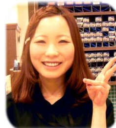
山梨県立富士北稜高校出身 (2008年度卒業)

大事な事は美容がどれだけ好きかだと思います。好きだからこそ続けられるし、やりがいはいどんな仕事よりもあります。美容師にぴったりの言葉をみなさんへの応援メッセージにさせていただきます。「笑顔と努力に勝るものはない!」です!!